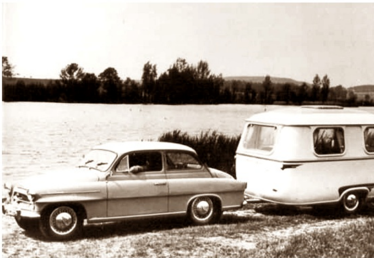
Przyczepa kampingowa Skoda - Jajko, autorstwa Otakara Diblika

poniedziałek, 01 lipca 2013 21:04 - Poprawiony poniedziałek, 12 sierpnia 2019 21:45