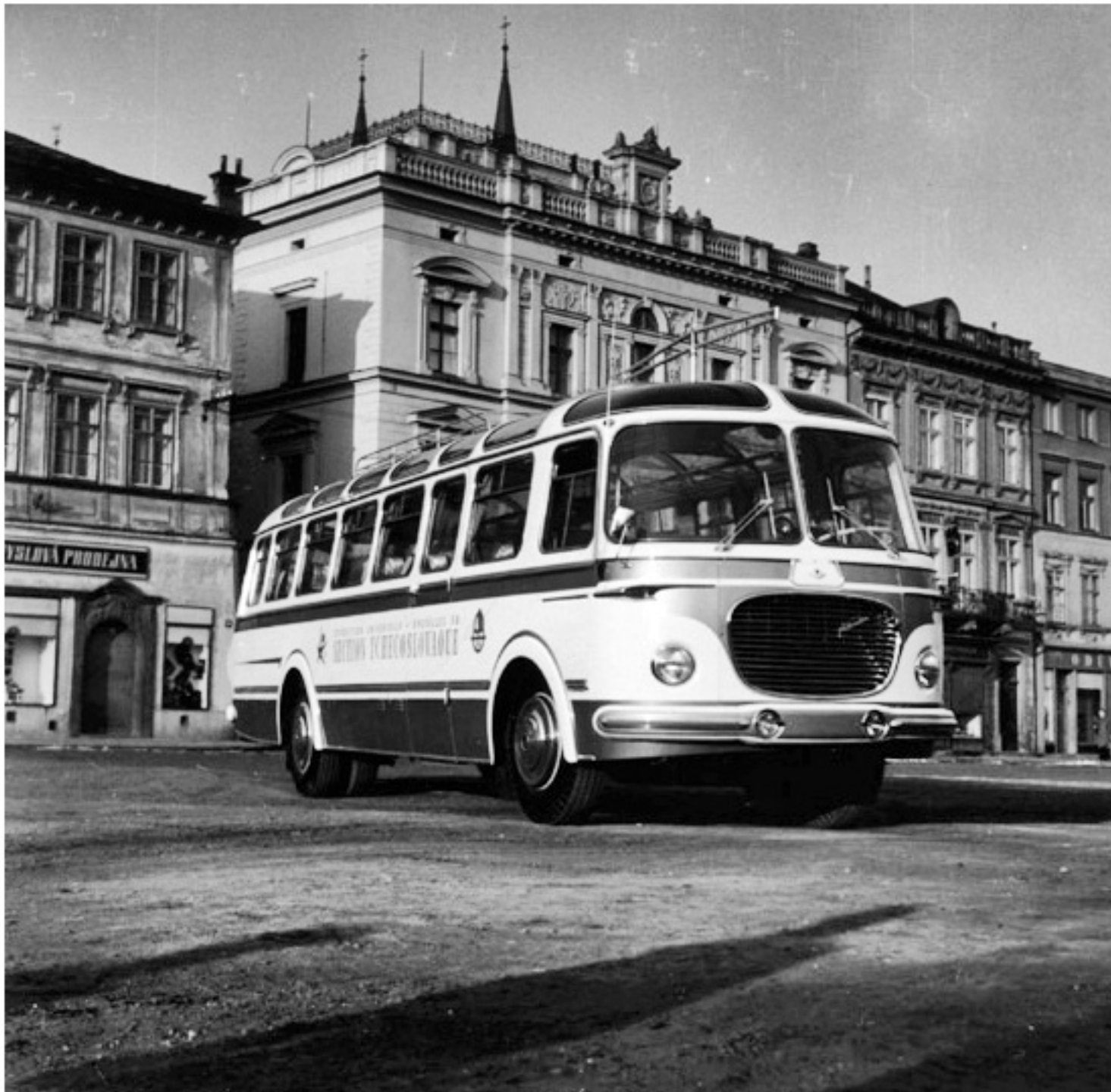
Skoda 706 RTO - wersja Bruksela 1958, pokaz przed wyjazdem na Expo 58

poniedziałek, 01 lipca 2013 21:04 - Poprawiony poniedziałek, 12 sierpnia 2019 21:45