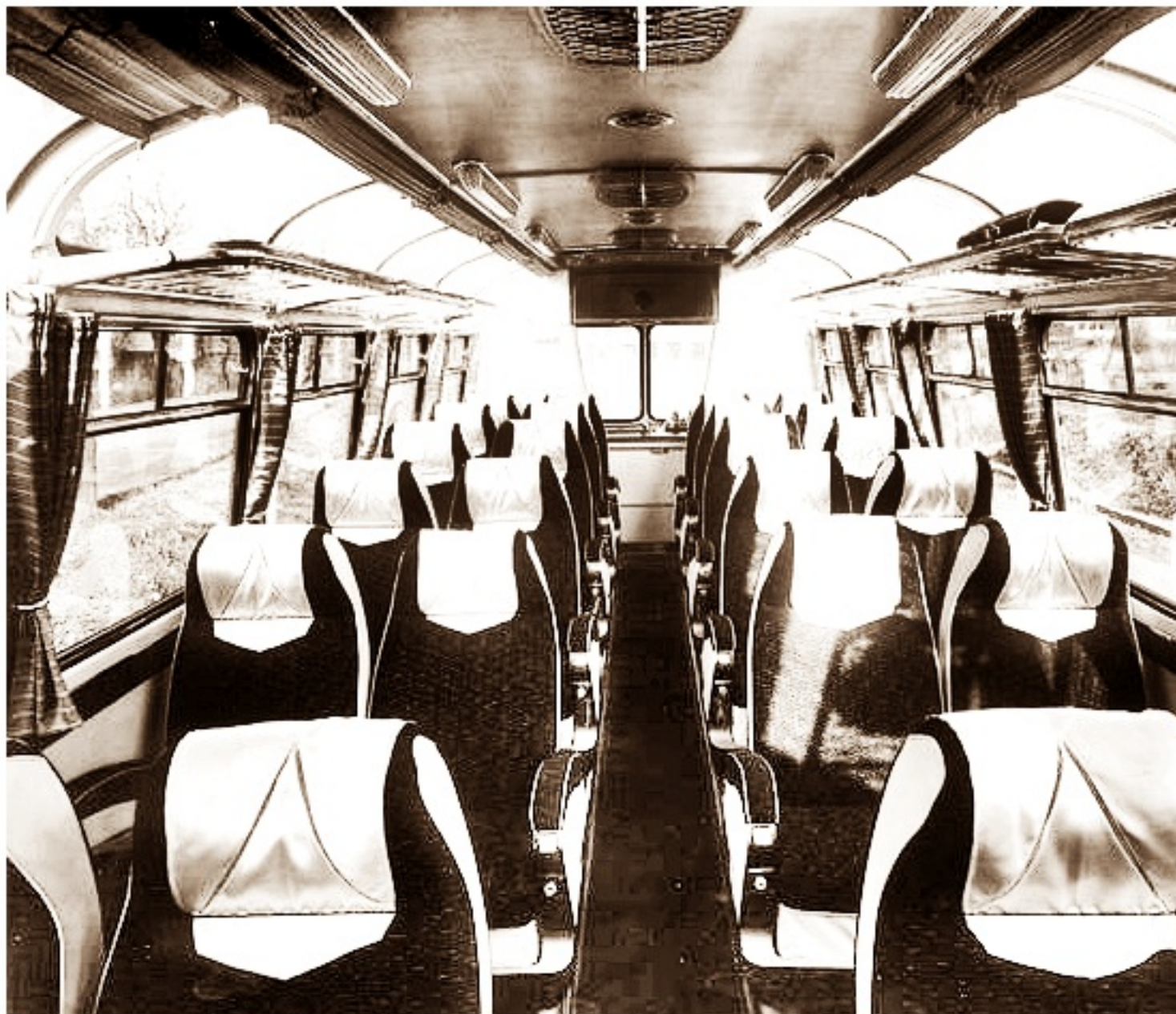
Wnętrze autobusu Skoda 706 RTO-LUX wersja Bruksela 19 design Otakar Diblík

poniedziałek, 01 lipca 2013 21:04 - Poprawiony poniedziałek, 12 sierpnia 2019 21:45