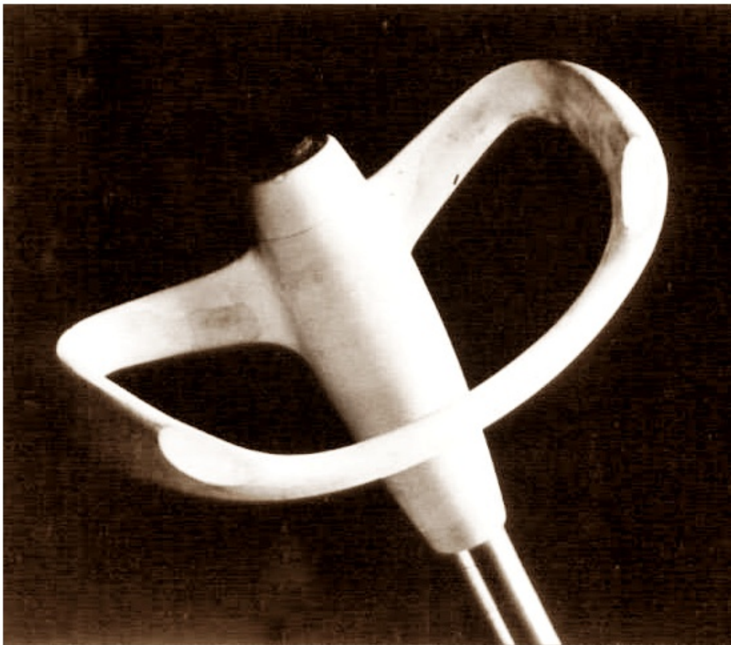
Wolant do samolotu Morawa autorstwa Otakara Diblika