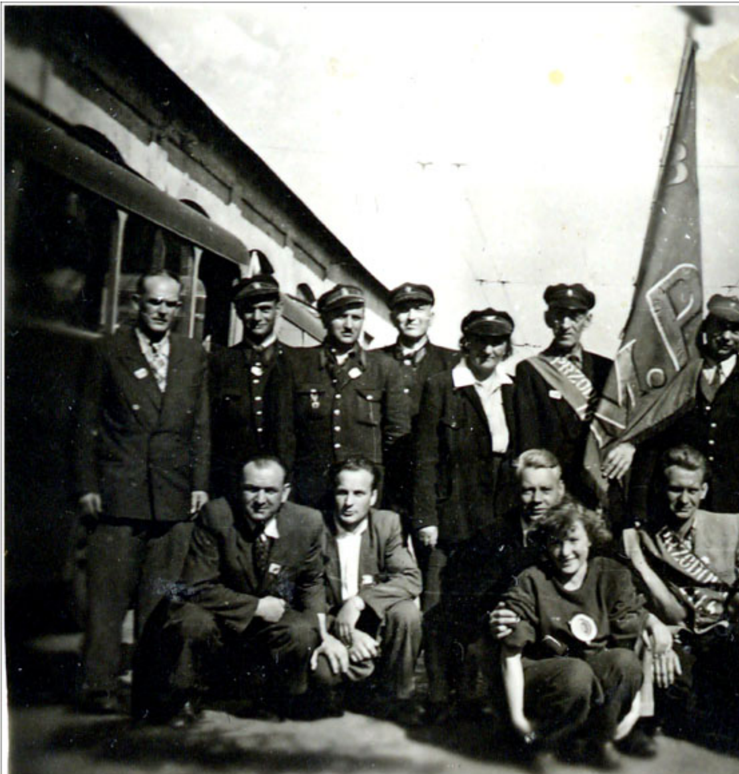
Zajezdnia "Łazienkowska" 1 maja 1952. Pracownicy Oddziału przed wyruszeniem na pochód 1-majowy

środa, 28 sierpnia 2013 18:38 - Poprawiony poniedziałek, 12 sierpnia 2019 21:48