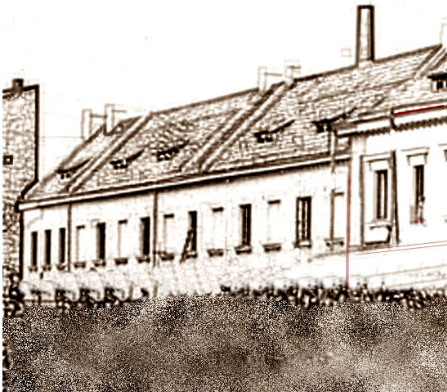
Szkic Zajezdni Autobusowej "Ujazdów" ok 1935 roku, na pierwszym planie tzw.

niekiedy nazywanej "Łazienkowską", ale w rzeczywistości to jest teren, który nie był nigdy częścią tej stacji.