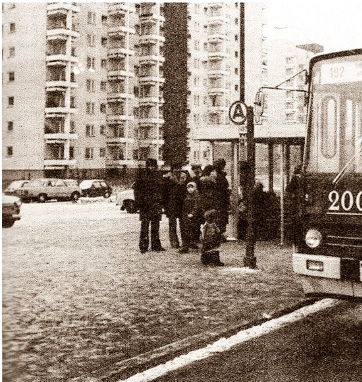
Ikarus 280.11 podczas jednego z pierwszych kursów w

piątek, 29 listopada 2013 12:50 - Poprawiony poniedziałek, 12 sierpnia 2019 21:52