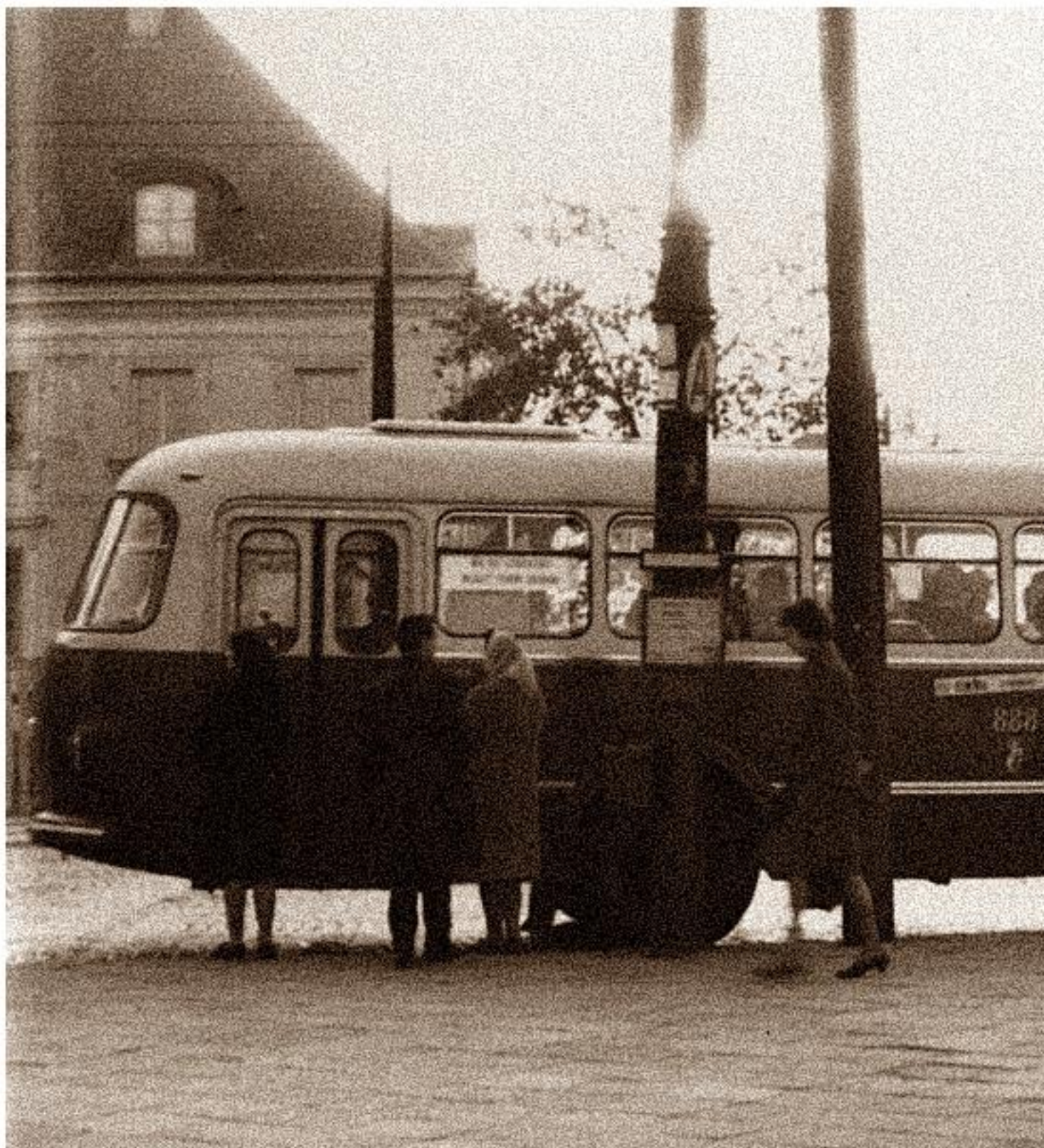
Jelcz Mex świeżo z fabryki. Pierwsza seria Jelczy bez świetlików z tyłu, ale je fabrycznie zderzakami. Nr tab. 888: produkcja 1964, R5, WW6279, od 29.03.1964 Plac Krasińskich - 1964

poniedziałek, 17 lutego 2014 19:10 - Poprawiony poniedziałek, 12 sierpnia 2019 21:57